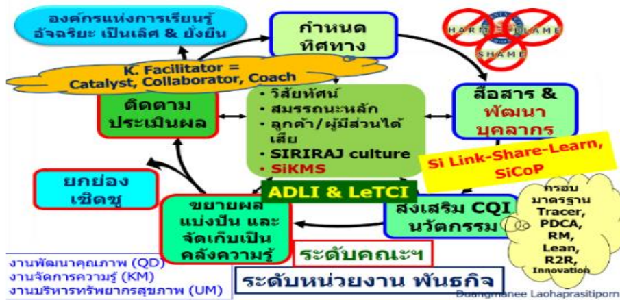
รูปที่ 2 กระบวนการพัฒนาคุณภาพ คณะแพทยศาสตร์ศิริราชพยาบาล

กำหนดเป้าหมายเชิงกลยุทธ์ของคณะฯ ด้านคุณภาพและการจัดการความรู้ตั้งแต่ปี พ.ศ. 2548 และต่อเนื่อง เพื่อสร้างและส่งมอบงานที่มีคุณภาพและปลอดภัย ทำให้มีการออกแบบกระบวนการพัฒนาคุณภาพคณะฯ (รูปที่ 2) ที่บูรณาการระบบคุณภาพและการจัดการความรู้ด้วย Siriraj Link-Share-Learn ใช้ SIRIRAJ Cultural Values ในการขับเคลื่อน โดยทุกพันธกิจและระบบงานสนับสนุนสำคัญมีการพัฒนาและผ่านการรับรองมาตรฐานระดับสากลอย่างต่อเนื่อง มุ่งสู่องค์กรที่น่าไว้วางใจ (high reliability organization: HRO) และวัฒนธรรมความปลอดภัย องค์กรแห่งการเรียนรู้ (learning organization: LO) และองค์กรที่มีผลลัพธ์ที่แสดงความเป็นเลิศ เป็นองค์กรสมรรถนะสูง (high performance organization: HPO)