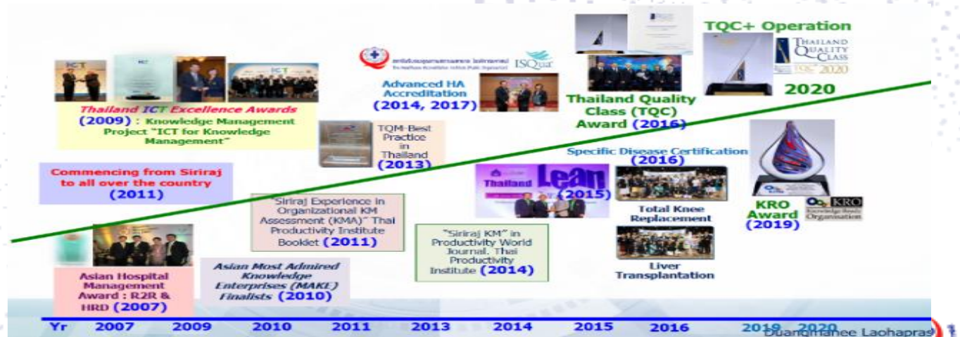
รูปที่ 3 การรับรองมาตรฐานและการรับรางวัลเป็นแห่งแรกของประเทศ

จากการเรียนรู้สู่ AHA อย่างต่อเนื่อง ทำให้มีการต่อยอดสู่การพัฒนาหลักสูตรและสร้างกระบวนการเรียนรู้มาตรฐาน เครื่องมือคุณภาพ ที่เอื้อต่อการปฏิบัติงานของบุคลากรทั้งคณะฯ เชื่อมโยงกับระบบ HRM และ HRD และการประยุกต์ใช้เกณฑ์และมาตรฐานต่างๆ อย่างบูรณาการ ส่งผลให้ปี พ.ศ. 2559 คณะฯ ได้รับรางวัล Thailand Quality Class (TQC) และปี พ.ศ. 2563 ได้รับรางวัล TQC Plus: Operation จากสถาบันเพิ่มผลผลิตแห่งชาติ นับเป็นสถาบันการศึกษาและคณะแพทย์แห่งแรกของประเทศไทยที่ได้รับรางวัลทั้งสองนี้ รวมทั้งรางวัลต่างๆ เป็นแห่งแรกของประเทศ (รูปที่ 3) ปลายปี พ.ศ. 2564 รับการเยี่ยมสำรวจเพื่อต่ออายุการรับรอง AHA ครั้งที่ 2 (อยู่ระหว่างการพิจารณาผลการประเมินจากกรรมการสถาบันรับรองคุณภาพสถานพยาบาล (องค์การมหาชน) (สรพ.) เกิดการเรียนรู้และต่อยอดกระบวนการเยี่ยมแบบ Empowerment & Hybrid evaluation ของสถาบันรับรองคุณภาพสถานพยาบาล (องค์การมหาชน) (สรพ.) เพื่อมุ่งสู่การเป็น World Class